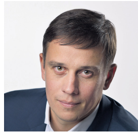
Депутат Государственной Думы от Челябинской области, член фракции ЛДПР Виталий Львович ПАШИН