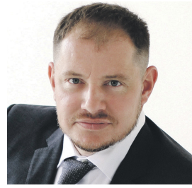
Депутат, член фракции ЛДПР в Законодательном Собрании Челябинской области Евгений Петрович РЕВА

📍 454007, г. Челябинск, пр. Ленина, 12-17