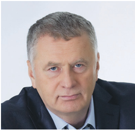
Председатель ЛДПР Владимир Вольфович ЖИРИНОВСКИЙ

📍 107078, г. Москва, 1-й Басманный переулок, 3, строение 1